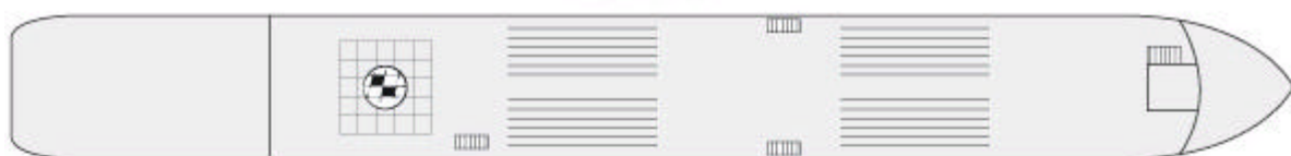
Oberdeck (*Kabinen verfügen über ein französisches Bett)