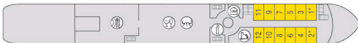
Hauptdeck (*Kabinen verfügen über ein französisches Bett)